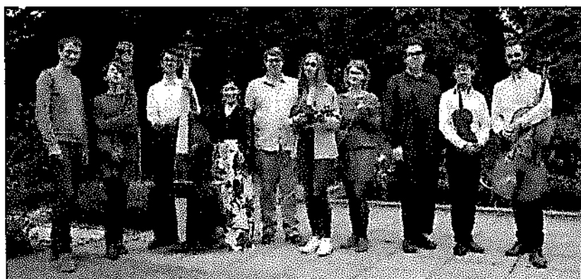
Young Bach Fellows, lichterij 2019-2021

De fellows hebben een mentor (musicus of staflied) en worden begeleid op het gebied van marketing, financiën, positionering en programmering. Fellows kunnen ook kennis en ervaring opdoen op andere gebieden, zoals productie of onderzoek. Het YBF-programma duurt twee jaar en wordt afgesloten met een door de fellows zelf geprogrammeerd en geproduceerd concert. Veel van de fellows komen terecht op onze remplaçantenlijst, wat op termijn kan leiden tot een plaats in de kernbezetting van het ensemble. Zo snijdt het mes aan twee kanten.