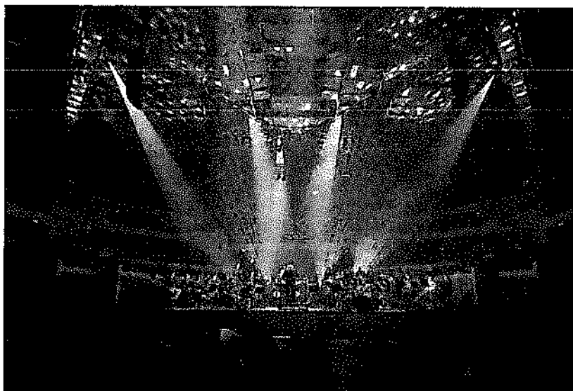
Matthäus-Passion o.l.v. Philippe Herreweghe, in TivoliVredenburg, Pieces of Tomorrow, april 2019