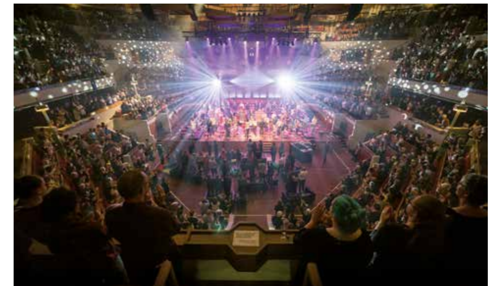
Pieces of Tomorrow in TivoliVredenburg (2017)