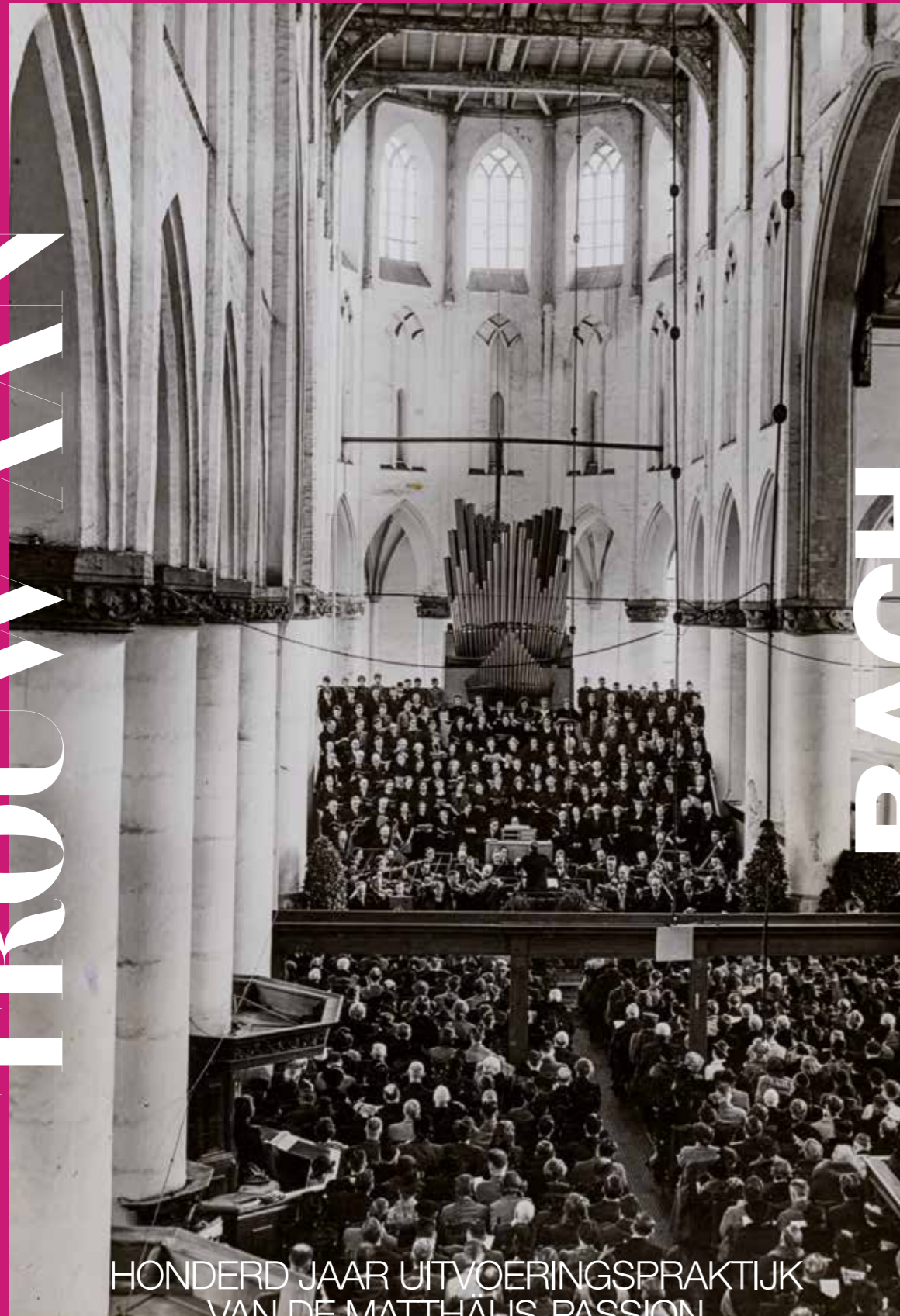
HONDERD JAAR UITVOERINGSPRAKTIJK VAN DE MATTHÄUS-PASSION