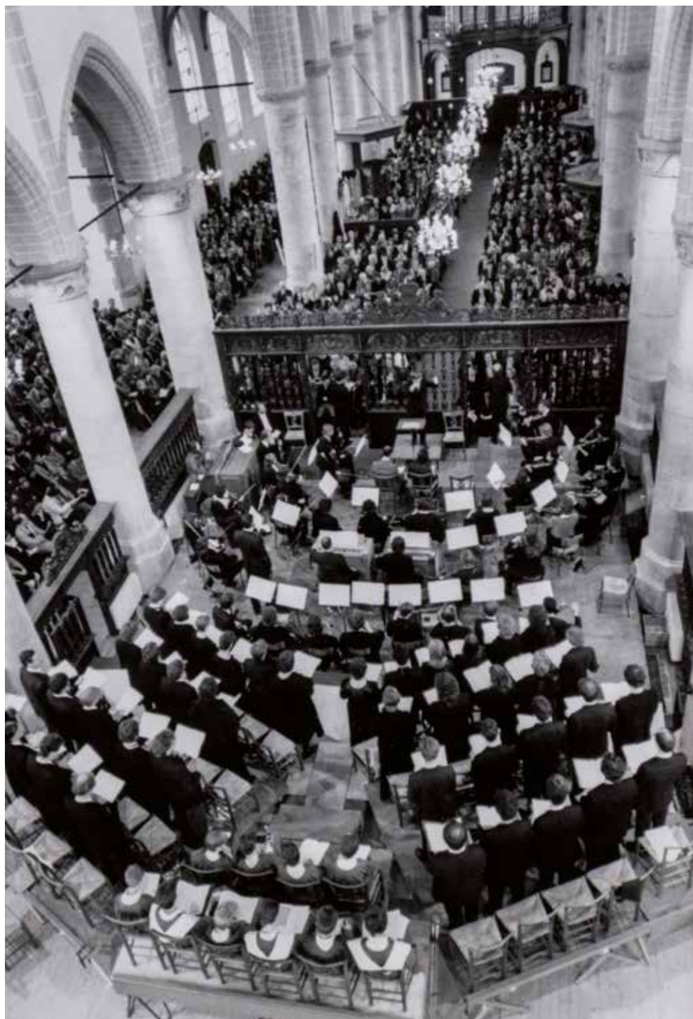
Uitvoering van de Matthäus-Passion in de Grote Kerk Naarden, 1986.