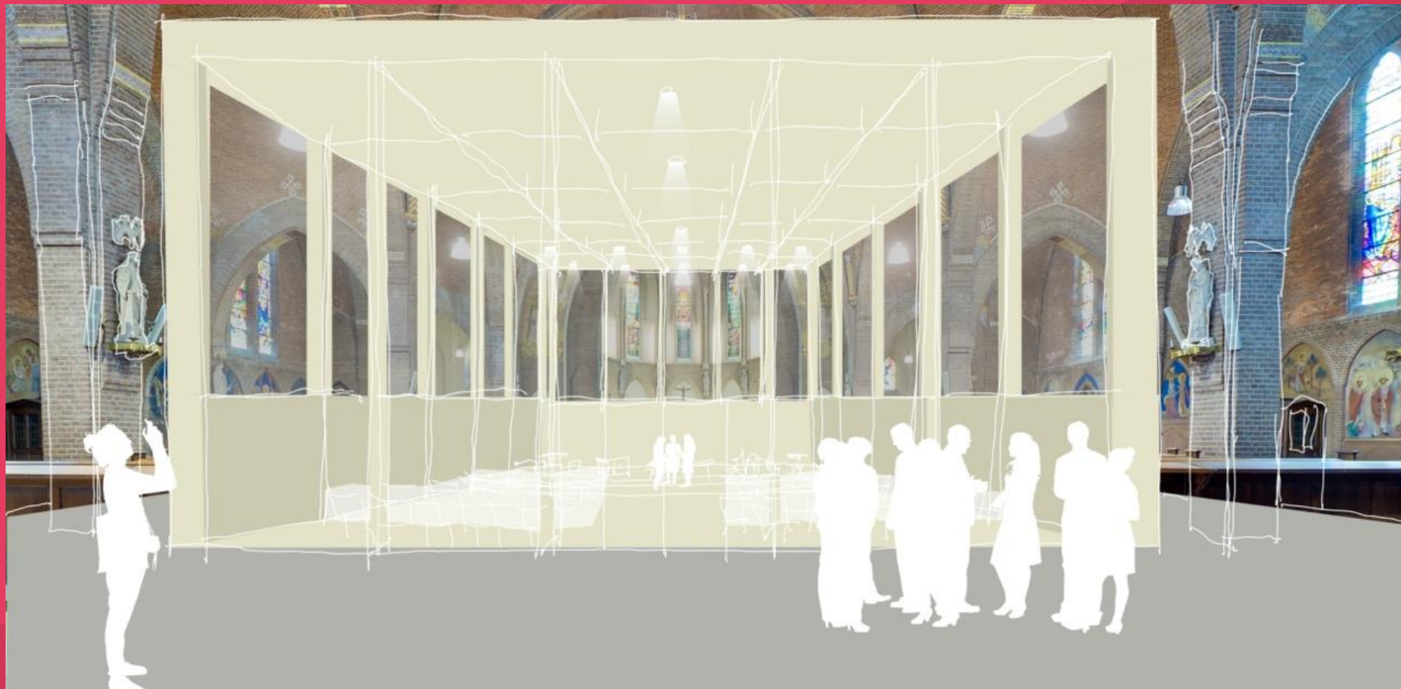
Impressie van mogelijke repetitieruimte in bestaand gebouw (in dit geval een kerk).