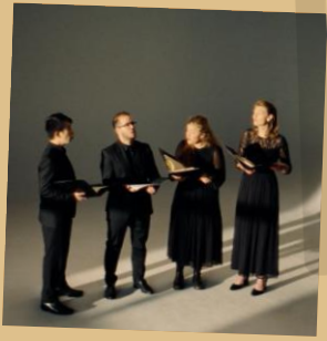
Repetitieruimte, inclusief inschuifbare publiektribune