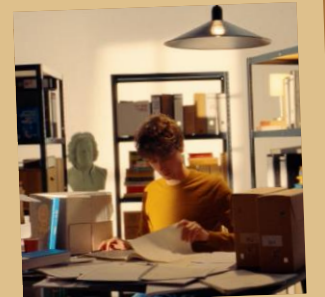
Bibliotheek en (instrumenten) opslag, archief