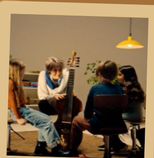
Educatieruimte voor diverse doelgroepen: van primair onderwijs tot hoger onderwijs