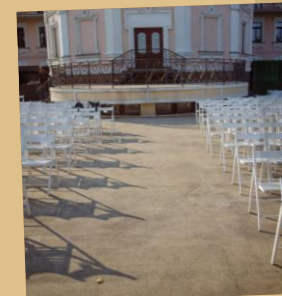
Buitenruimte voor bijv. Buitenmanifestaties, buitenconcerten etc.