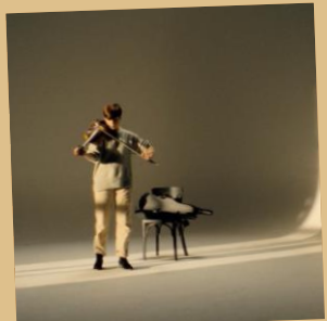
Meerdere (kleine) repetitieruimtes/studio's