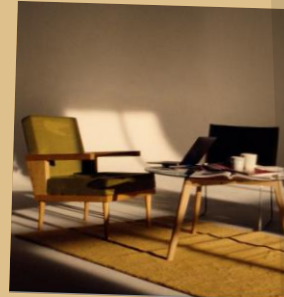
Ontmoetingsruimte voor publiek en kleinschaliger ontmoetingen.