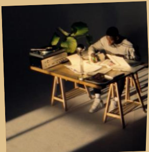
Kantoor- en vergaderruimte